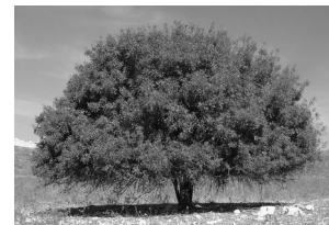
terebinthus, -ī (f)

polenta, -ae (f): cibus vilissimus ex farinā tostā