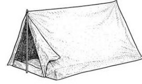
tabernaculum, -ī (n)

praecidere: abscindere, amputare, secare